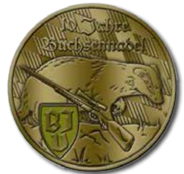
Gestaltung: Nicole Schmidpeter

Die BJV-Büchsenadel feiert dieses Jahr nicht nur ihr zehnten-, sondern sogar schon ihr elfjähriges Jubiläum: Seit dem Jahr 2007 kann sie von den Jägerinnen und Jägern durch Erfüllung der entsprechenden Anforderungen am Schießstand erworben werden. Die Anforderungen sind im „BJV-Übungsheft für das jagdpraktische Schießen“ hinterlegt, in dem man sich seinen erfolgreichen Übungsnachweis eintragen lassen kann. Sicheres, waid- und tierschutzgerechtes Jagen erfordert eine treffsichere Schießleistung der Jägerinnen und Jäger. Aufgrund der jagdlichen Ethik und des Tierschutzes bedarf es einer regelmäßigen und zuverlässigen Überprüfung des eigenen handwerklichen Könnens der Jäger sowie des Umgangs mit den entsprechenden, eingesetzten Jagdwaffen.